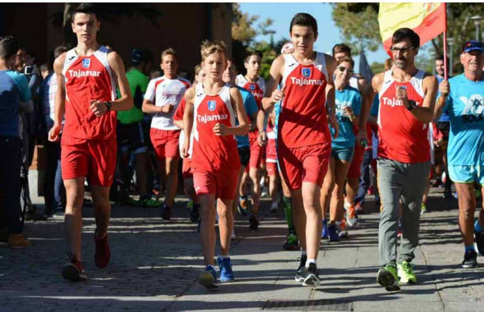
JESÚS ÁNGEL GARCÍA BRAGADO CHUSO. MÁS QUE UN ATLETA